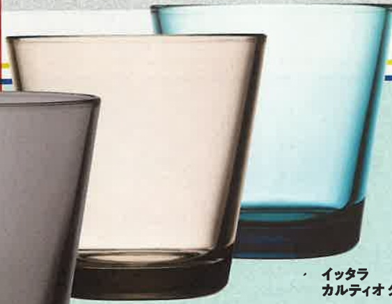
イッタラ カルティオ タンブラーペア

デコラティブなテーブルウェアがまだ多かった時代。カイ・フランクは贅飾を極力省き、シンプルを追求することで機能美と合理的な生産を実現、「 日常にイイものを取り入れる 」という新常識を打ち立てました。ほら、良心的と言われる理由わかるでしょ？ 類似品は数あれど、ここまで洗練されたガラスは唯一無二！ これを飲めば、ただの水水道もウマッ♡ってなりますよ。